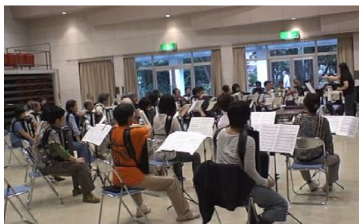
上の写真は全体練習の様子