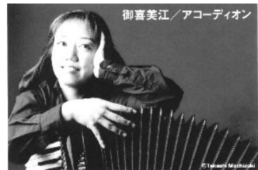
写真はチラシより転写

ある日、『シェルプールの雨傘』の楽譜が送られてきた。尊敬する佐渡裕氏との共演なので、「ええ〜?映画音楽?」とは言わず、真面目に練習を始めた。すると序奏からして、すでにゾクゾク感が伝わってくるではないか?その叙情溢れる美しいメロディーと切ない響きに私はすっかり酔いしれ、時間の経つのも忘れて弾き続けていた。それはうっかり迷い込んだ路地があまりに美しく、そこから出られなくなったような体験だった。